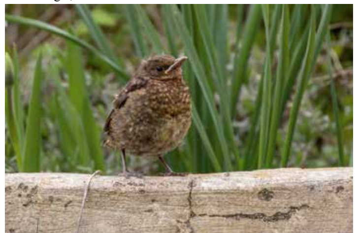
Junge Amsel