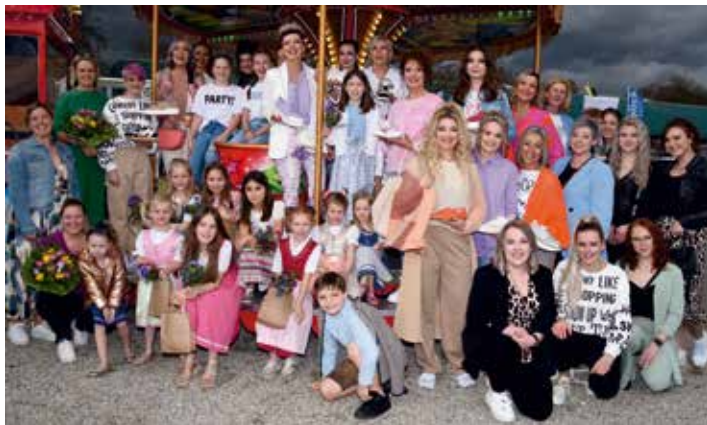
Großen Beifall ernteten die talentierten Nachwuchs- (Vordergrund) sowie Hobby-Models bei der abwechslungsreich präsentierten „Kuhlmuu- und Schuhbar-Modeschau“.

des Ruhstorfer Gebraucht-hundevereins Smiling Dogs, Schnupper-Roulettspiele der Bad Füssinger Spielbank oder Oldtimer-Treffs des Pockinger Motorradclubs nicht minder auch „g'mütliche Wirtshaus-Stunden im Schärdinger Bums'n