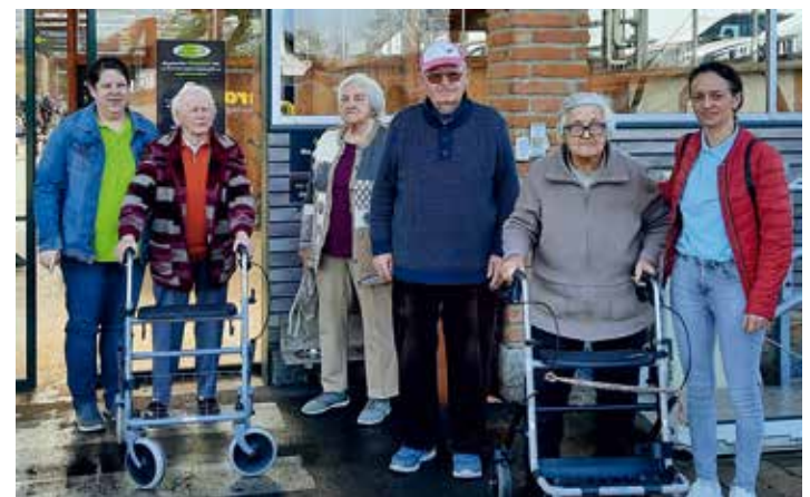
Ausflug in die Inntag-Gärtnerei.